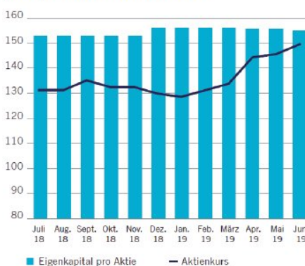
Eigenkapital pro Aktie und Aktienkurs: